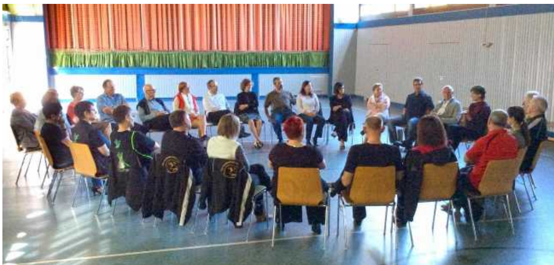
Erste Infos im Stuhlkreis „auf Augenhöhe“

des Tanzsportverbandes Rheinland-Pfalz in Ramstein am So.14.Mai 2017