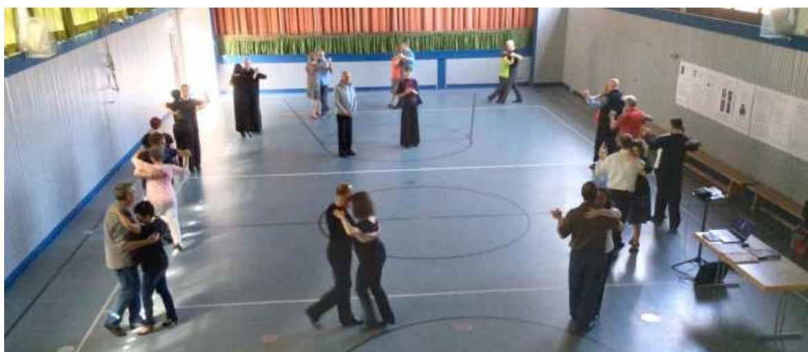
Praktischer Unterricht durch Tanzen in der Ronda