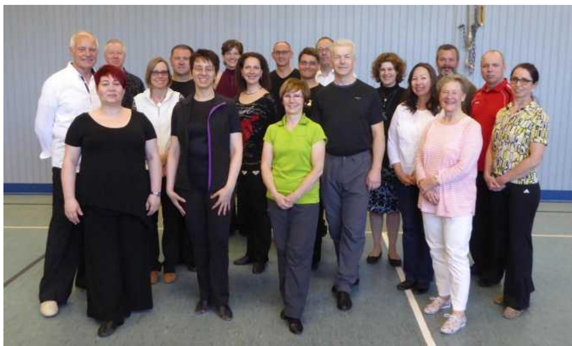
Gruppenbild der Trainer zum Abschluss